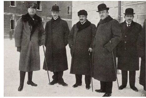
Verhandlungsführer auf Seiten der Mittelmächte in Brest-Litowsk (von links): General Hoffmann, Ottokar Graf Czernin, Talât Pascha, Richard von Kühlmann